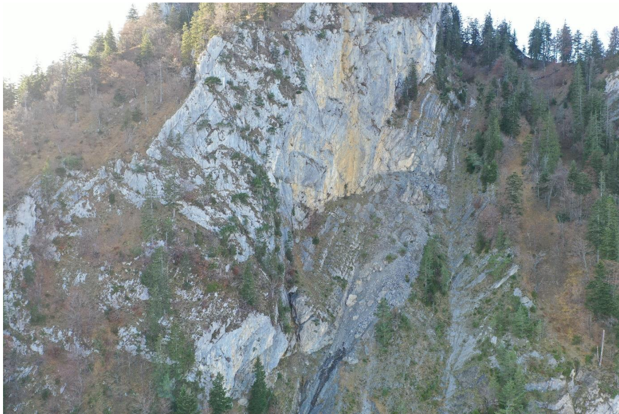
Abbildung 1: Ostwand des Gersauerstockes

Unsere Vorfahren waren sich das Leben in den Bergen seit Jahrhunderten gewohnt. Mit allen Naturgefahren lernten sie zu leben und passten sich ständig den neuen Gegebenheiten an. Das hat sich auch in der heutigen Zeit nicht geändert. Auch wir müssen uns den neuen Gegebenheiten anpassen.