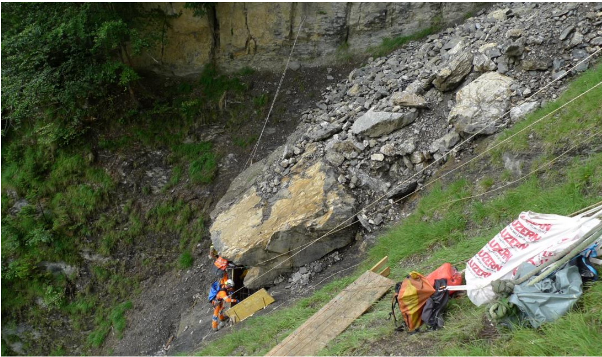
Abbildung 2: Detailaufnahme eines Lockergesteinspaketes am Fuss der Ostwand des Gersauerstockes

Die folgende Abbildung zeigt die Gefahrenflächen von Murgängen in der Stockbachrunse. Sie basieren zum einen auf der Analyse des Ereignisses von 1934 wie auch auf denjenigen in den letzten Jahren und Jahrzehnten. Zusätzlich wurden die aktuellen Verhältnisse im Einzugsgebiet durch Fachpersonen begutachtet. Mit Unterstützung von Computerprogrammen wurden Murgänge simuliert und die entsprechenden Kennwerte und Gefahrenflächen hergeleitet.