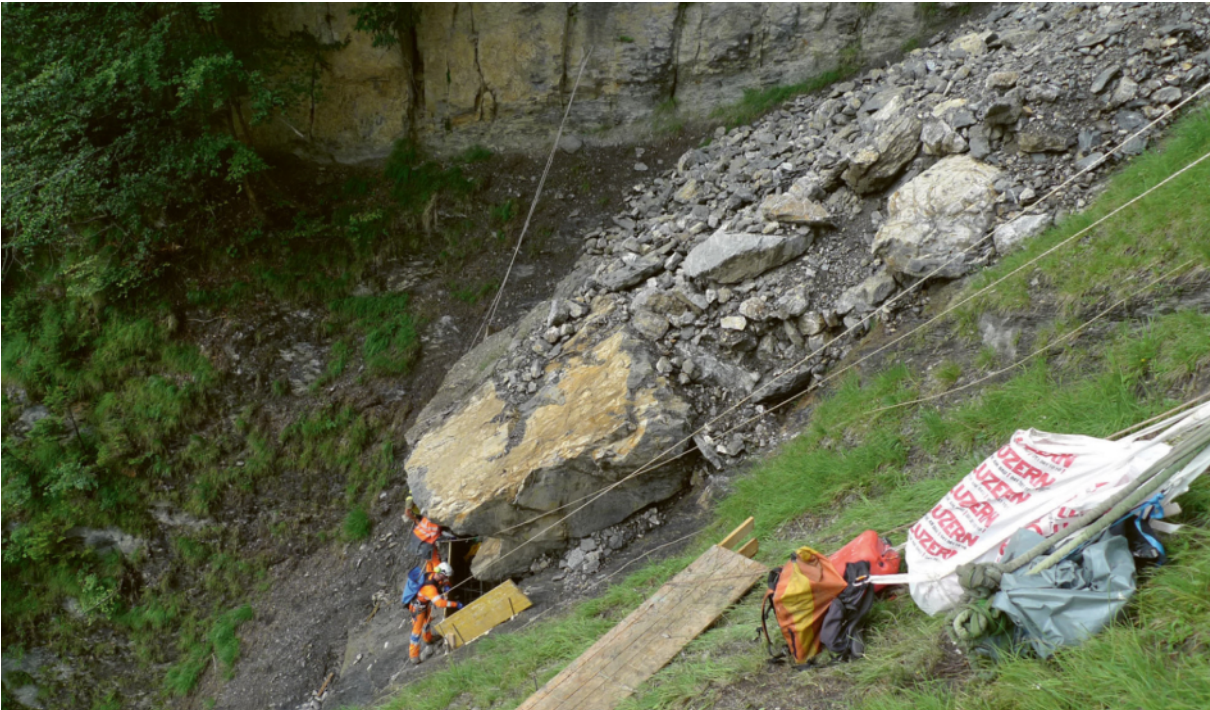
Abbildung 2: Detailaufnahme eines Lockergesteinspaketes am Fuss der Ostwand des Gersauerstockes.

Die folgende Abbildung zeigt die Gefahrenflächen von Murgängen in der Stockbachrunse. Sie basieren zum einen auf der Analyse des Ereignisses von 1934 wie auch auf denjenigen in den letzten Jahren und Jahrzehnten. Zusätzlich wurden die aktuellen Verhältnisse im Einzugsgebiet durch Fachpersonen begutachtet. Mit Unterstützung von Computerprogrammen wurden Murgänge simuliert und die entsprechenden Kennwerte und Gefahrenflächen hergeleitet.