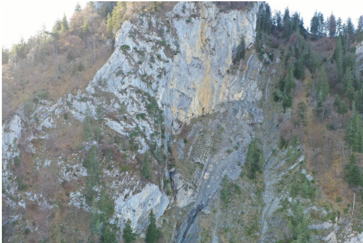
Abbildung 1: Ostwand des Gersauerstockes

Unsere Vorfahren waren sich das Leben in den Bergen seit Jahrhunderten gewohnt. Mit allen Naturgefahren lernten sie zu leben und passten sich ständig den neuen Gegebenheiten an. Das hat sich auch in der heutigen Zeit nicht geändert. Auch wir müssen uns den neuen Gegebenheiten anpassen.