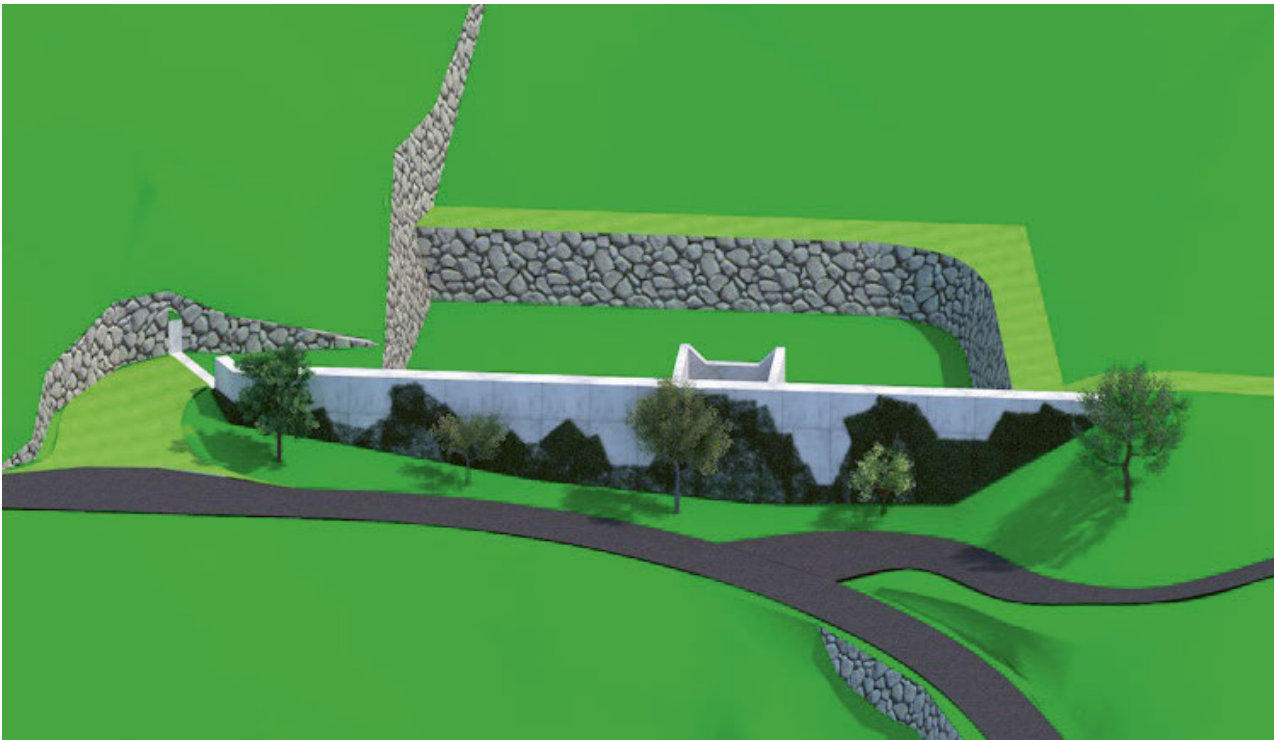
Abbildung 4: Visualisierung Geschiebesammler Breitloh

Gemäss aktuellem Planungsstand ist eine Kombination von Massnahmen vorgesehen. Zentrales Element ist dabei ein Geschiebesammler im Gebiet Breitloh mit einem Fassungsvermögen von rund 5'000 m 3 (siehe folgende Abbildung). Ein weiterer, sehr viel kleinerer Geschiebesammler (200 m 3 ) soll im Gebiet oberhalb Tannen an der Rotflüelenstrasse erstellt werden. Im Bereich Platten und Tannen sind zudem Geländeadaptierungen vorgesehen. Ergänzend zu diesen baulichen Massnahmen braucht es eine klare Regelung z.B. betreffend Unterhalt der Massnahmen.