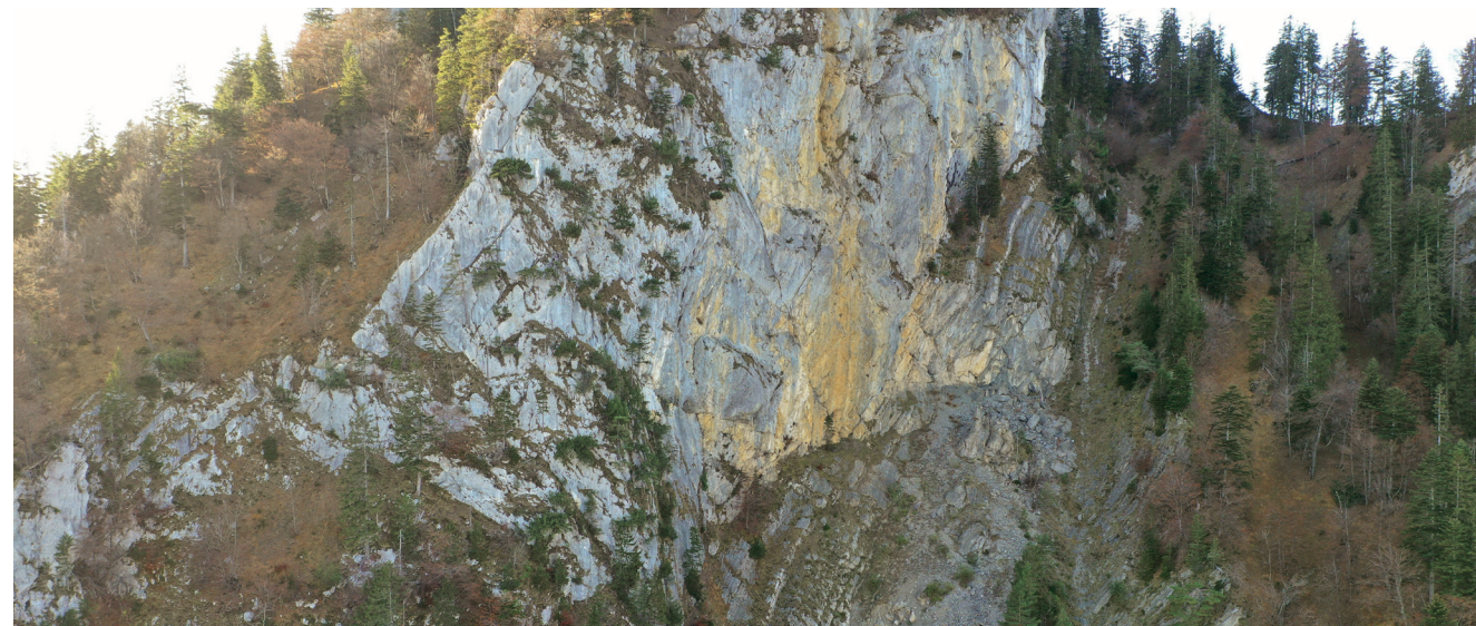
Abb. 1: Ostwand des Gersauerstockes

Der Vollständigkeit halber sei erwähnt, dass es einigen Fachverantwortlichen des Kantons gelungen ist, die Versicherungsgesellschaft «die Mobiliar Generalagentur Schwyz» als grosszügige Gönnerin für dieses Naturschutzpräventionsprojekt mit dem grössten Schadenpotenzial im Kanton zu gewinnen. Der Beitrag wird zur Reduktion der Restkosten der Flurgenossenschaft Stockbachrunse eingesetzt. «Die Mobiliar» möchte nicht nur für durch Naturereignisse entstandene Schäden aufkommen, sondern sie möchte künftige Schäden verhindern oder zumindest verringern. Daher übernimmt «die Mobiliar» als Genossenschaft Mitverantwortung bei Massnahmen zur Gefahrenprävention. Mit ihrem Überschussfonds unterstützt «die Mobiliar» Präventionsprojekte im Zusammenhang mit Naturgefahren – seit 2006 betrifft dies über 170 Projekte in der Schweiz. Den Beschluss, das Projekt «Murgangschutz Stockbachrunse Gersau» mit CHF 250'000.00 zu unterstützen, fasste «die Mobiliar» am 21. Mai 2024.