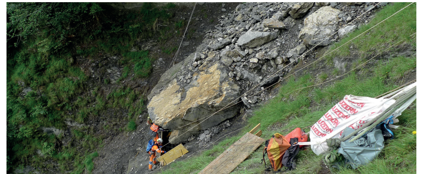
Abb. 2: Detailaufnahme eines Lockergesteinpaketes am Fuss der Ostwand des Gersauerstockes

Am Fuss des Gersauerstockes hat es auch heute noch diverse Bereiche mit instabilen Lockergesteinen (siehe Beispiel Abbildung 2). Ebenfalls ist nicht auszuschliessen, dass die gebräuche Felswand neue Felsstürze produziert. Starkniederschlagsereignisse dürften aufgrund des Klimawandels eher zunehmen. Dementsprechend sind alle Zutaten vorhanden, damit auch in Zukunft grosse Murgang-Ereignisse wie im Jahr 1934 eintreten können. Aufgrund der regen Bautätigkeit in den letzten Jahrzehnten müsste heute damit gerechnet werden, dass zahlreiche Wohngebäude zumindest stark beschädigt, teilweise wohl auch zerstört würden.