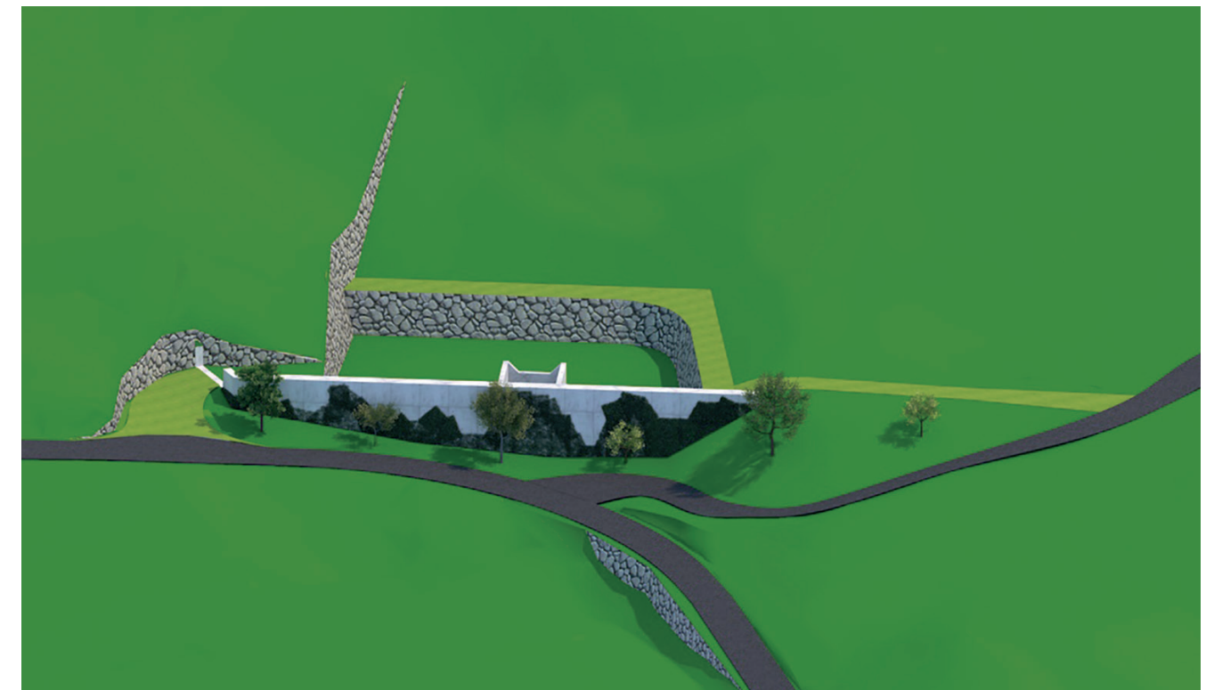
Visualisierung Geschiebesammler Breitloh

Bauherrschaft ist die zu diesem Zweck gegründete Flurgemeinschaft Stockbachrunse. Die Gründung der Flurgemeinschaft wurde von der Regierung mit Beschluss vom 9. November 2021 genehmigt. Mitglieder der Flurgemeinschaft sind all jene, welche durch Murgänge in der Stockbachrunse bedroht sind und von den Schutzmassnahmen direkt profitieren.